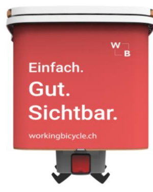
Spazio pubblicitario retro