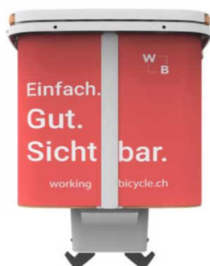
Spazio pubblicitario fronte 2A (r.) e 2B (l.)