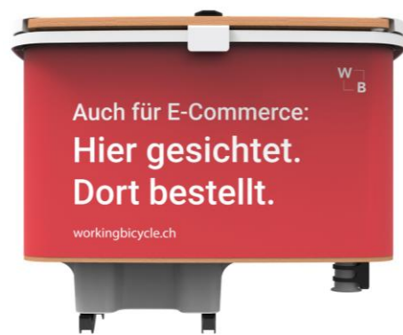
Spazio pubblicitario a sinistra