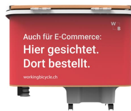
Spazio pubblicitario a destra