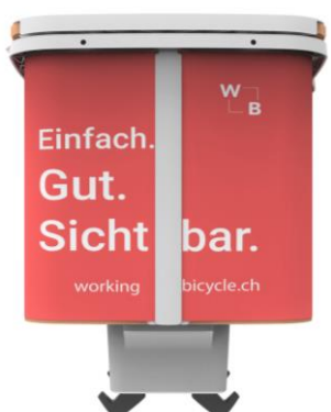
Côté avant 2A (g.) et 2B (d.)